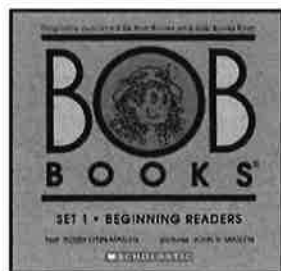
←BOB BOOKS SET 1 (ブルー1で使用)

5月は、ブルー1はBOOK 2, Sam、ブルー2はBOOK2, Up, Pup、パープル1は4月に引き続き BOOK 1, Floppy Mop、パープル2も引き続き BOOK 1. Ten Men を使います。毎週のレッスンにお持ち下さい。