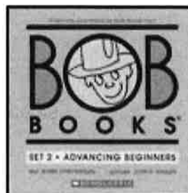
←BOB BOOKS SET 2 (ブルー2で使用)