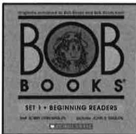
←BOB BOOKS SET 1 (ブルー1で使用)

5月は、ブルー1はBOOK 2, Sam、ブルー2はBOOK2,Up,Pup、パープル1はBOOK 2, Lolly-Pops、パープル2はBOOK 2 Bump!をお渡しします。毎週のレッスンにお持ち下さい。