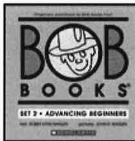
←BOB BOOKS SET 2 (ブルー2で使用)