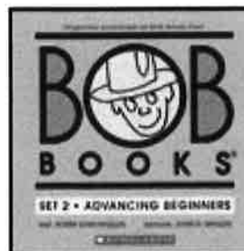
←BOB BOOKS SET 2 (ブルー2で使用)