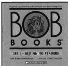
←BOB BOOKS SET 1 (ブルー1で使用)

5月は、ブルー1はBOOK 2, Sam、ブルー2はBOOK2, Up, Pup、パープル1はBOOK 2, Lolly-Pops、パープル2はBOOK 2 Bump!をお渡しします。毎週のレッスンにお持ち下さい。